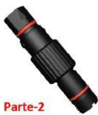
Parte-2 Tubo Principal