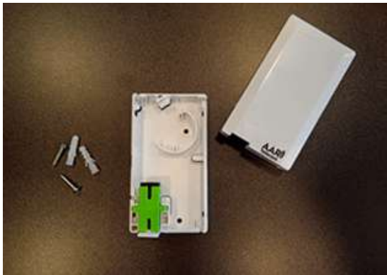
CAIXA TERMINAL 4X2